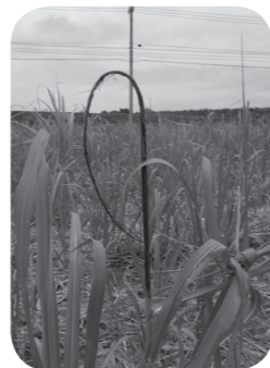
▲ 黒穂病に罹ったさとうきび