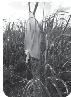
▲ 袋を被せて抜き取る